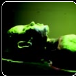
צילום מתוך תהליך העבודה: אתי ויזר

תודות: לליאור פרידמן , רון קציר תודה מיוחדת: לרחל יצחק